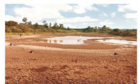
Represa de Tambuí (SP) está praticamente seca.