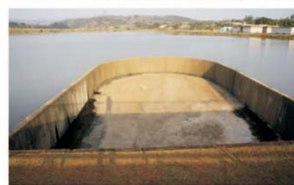
Nível da barragem de Vargem está abaixo do bico de pato.

• Usar água da rede pública em postos de combustíveis para lavar carros, com exceção dos itens de segurança do veículo (para-brisa e lanternas).