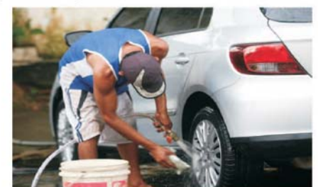
Não jogue este líquido nas ruas públicas. Mantenha a cidade limpa.

As denúncias por desperdício de água devem ser feitas pelos telefones: 3641-9000 (Prefeitura), 3641-1011, 3641-2195 e 3641-3538 (SAE) e 3641-5877 e 199 (Guarda Municipal). Não é necessária identificação do denunciante.