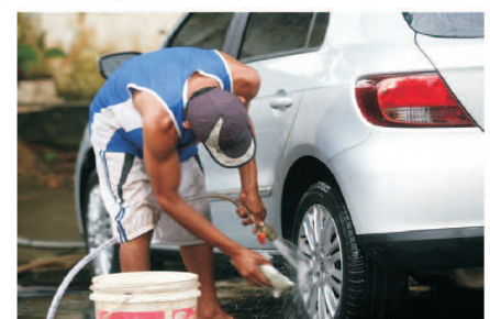
*Imagens meramente ilustrativas. Não jogue este impresso em via pública. Mantenha a cidade limpa.

As denúncias por desperdício de água devem ser feitas pelos telefones: 3641-9000 (Prefeitura), 3641-1011, 3641-2195 e 3641-3538 (SAE) e 3641-5877 e 199 (Guarda Municipal). Não é necessária identificação do denunciante.