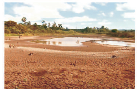
Represa de Tambuí (SP) está praticamente seca.