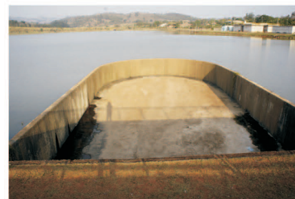
Nível da barragem de Vargem está abaixo do bico de pato.

• Usar água da rede pública em postos de combustíveis para lavar carros, com exceção dos itens de segurança do veículo (para-brisa e lanternas).